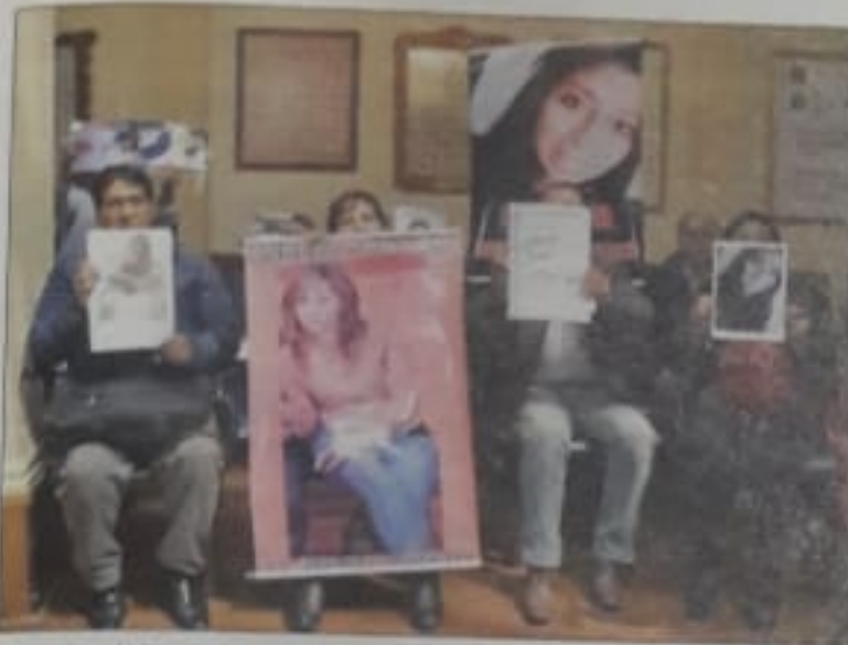
Familiares de las víctimas exigen justicia.