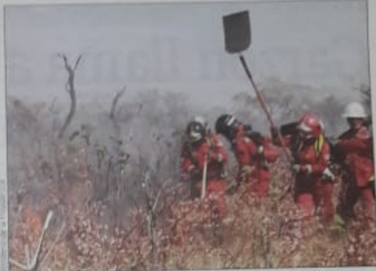
Bomberos combaten uno de los incendios en la región chiquitana.

Al día siguiente, el Gobierno nacional conformó el Gabinete de Emergencia Ambiental para combatir los incendios por aire y tierra, y para ello contrató las tres aeronaves-bombero más grandes del mundo,